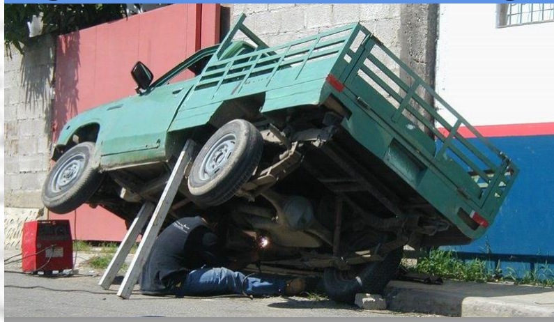
R.E.P.O.N.S.E. : le mécanicien a oublié d'allumer les feux de détresse.